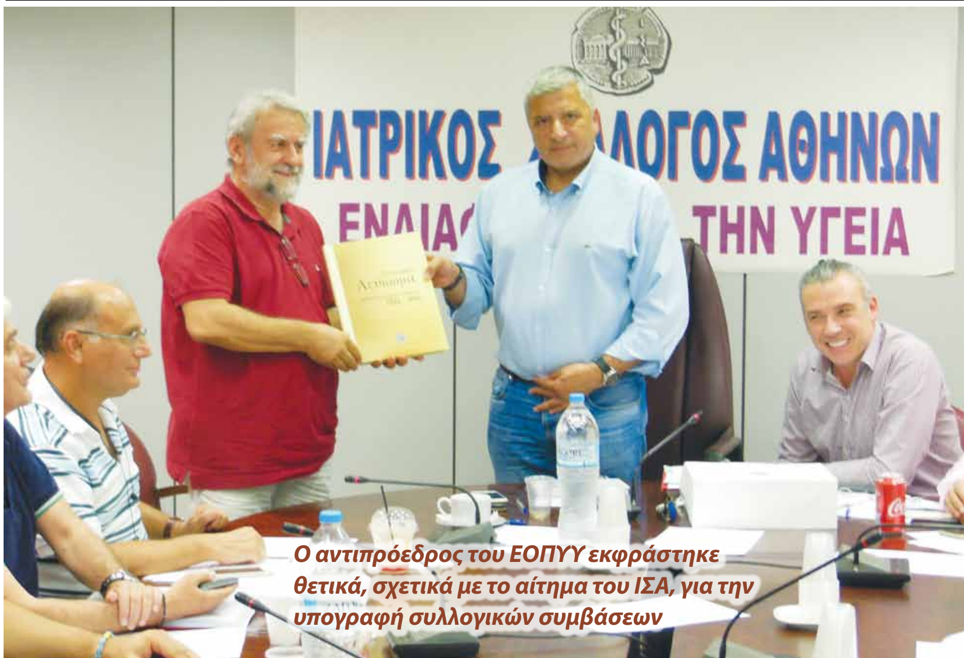
Ο αντιπρόεδρος του ΕΟΠΥΥ εκφράστηκε θετικά, σχετικά με το αίτημα του ΙΣΑ, για την υπογραφή συλλογικών συμβάσεων