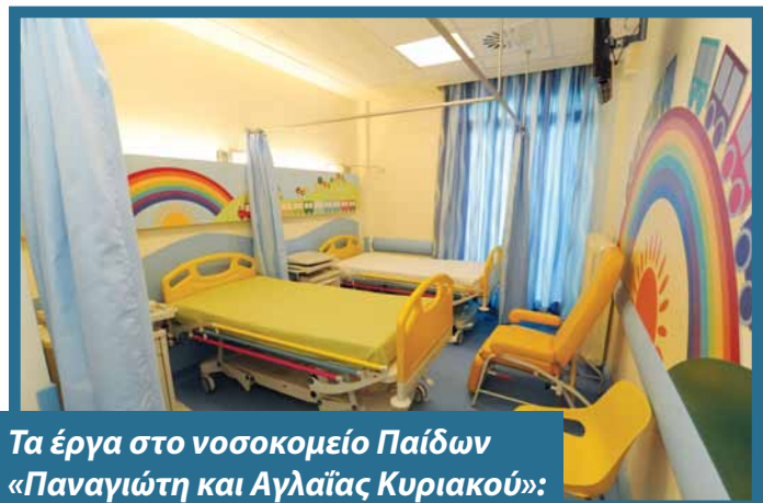
Τα έργα στο νοσοκομείο Παιδίων «Παναγιώτη και Αγλαΐας Κυριακού»: