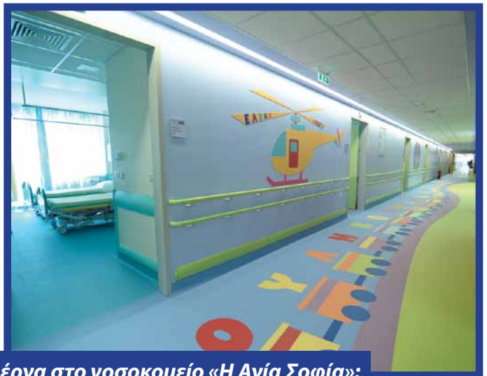
Τα έργα στο νοσοκομείο «Η Αγία Σοφία»:

Ο ΟΠΑΠ ξεκίνησε το έργο ανακαίνισης των δύο εξειδικευμένων νοσοκομείων, που εξυπηρετούν τις ανάγκες παιδιών από όλη την Ελλάδα, τον Απρίλιο του 2014 στο πλαίσιο του προγράμματος Εταιρικής Υπευθυνότητάς του. Μέχρι σήμερα έχουν υλοποιηθεί 19 έργα συνολικού εμβαδού 7.480 τετραγωνικών μέτρων. Συγκεκριμένα, έχει γίνει πλήρης αναδιάρθρωση και εκσυγχρονισμός νοσηλευτικών μονάδων, χωρητικότητας 230 κλινών και 50 θερμοκοιτίδων. Επιπλέον έχουν πραγματοποιηθεί σημαντικές επισκευές και παρεμβάσεις στις κεντρικές εισόδους, τα κλιμακοστάσια και τις αίθουσες αναμονής και έχει γίνει αντικατάσταση ενός ανελκυστήρα. Σε όλες τις εργασίες που έχουν πραγματοποιηθεί στα νοσοκομεία, περιλαμβάνεται η δημιουργία χώρων υγιεινής στους θαλάμους νοσηλείας, η εγκατάσταση νέου ιατρικού και ξενοδοχειακού εξοπλισμού και ο πλήρης εκσυγχρονισμός των ηλεκτρικών και μηχανολογικών εγκαταστάσεων, σύμφωνα με τις σύγχρονες διεθνείς προδιαγραφές.