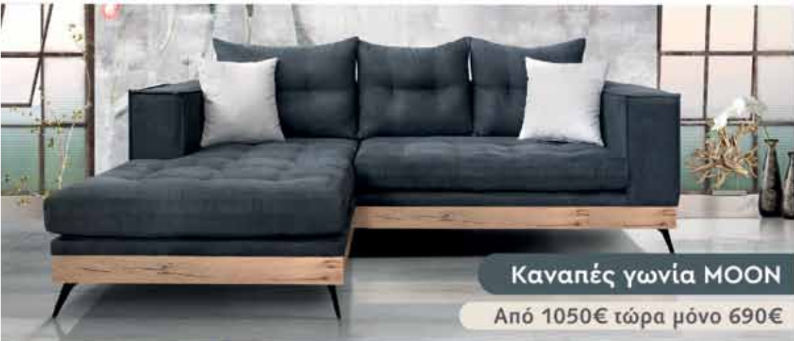
Καναπές γωνία MOON