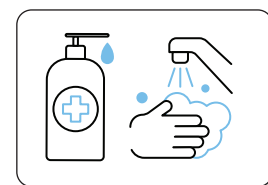
Απολυμαίνετε τα χέρια σας Wash your hands

Ο Πρόεδρος του Ιατρικού Συλλόγου Αθηνών και Περιφερειάρχης Αττικής ΓΙΩΡΓΟΣ ΠΑΤΟΥΛΗΣ